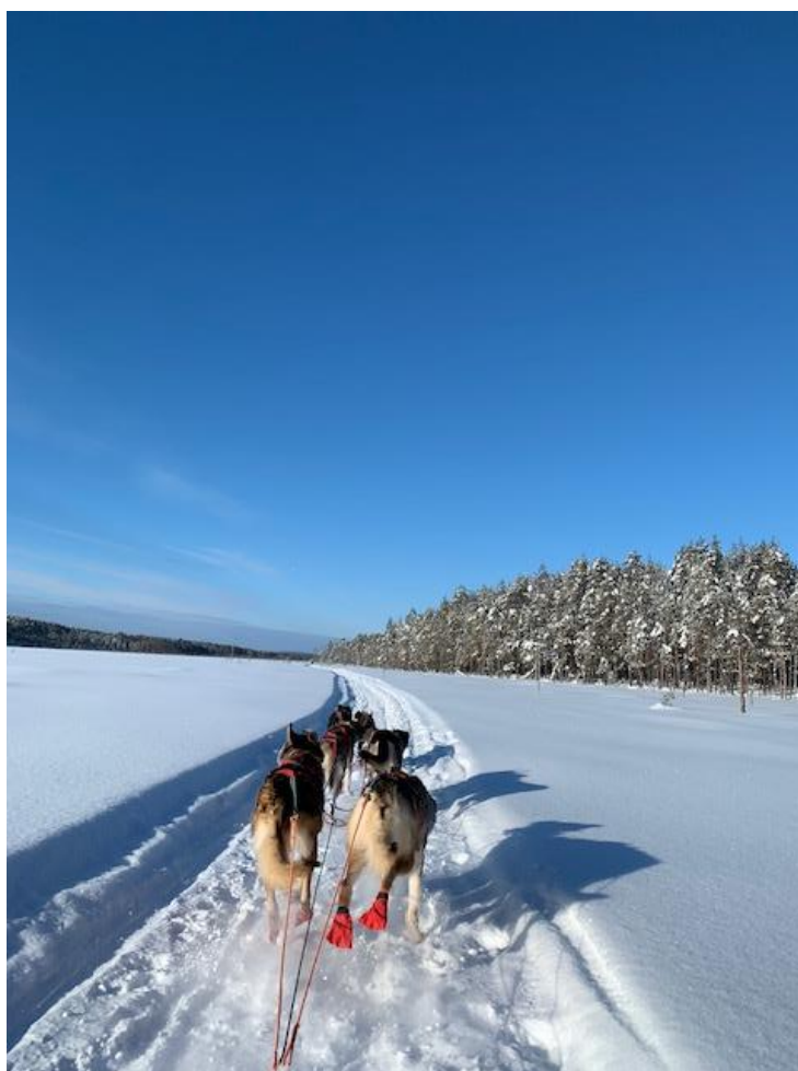
Kuva 1 Ruunaa Race 2021